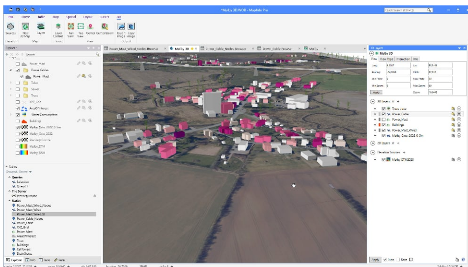
MapInfo Pro vous aide à explorer, modéliser et agir sur les localisations à travers le monde.

Créez des modèles qui soient facilement compréhensibles. Permettez aux décideurs de parfaitement comprendre les attributs et les inconvénients de chaque site et chaque scénario. Aidez-les à prendre les mesures qui permettront à votre organisation d'avancer.